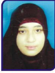
ઝાકેરા મો.ઝકરીયા પાંડોર ગામ:- સીમલક ૭૮.૧૬ %