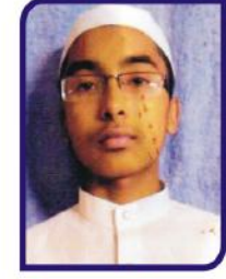
હુશોન અઝીઝ નાના ગામ:- સીમલક ૬૧.૫૦ %