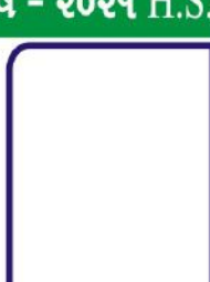
મીદહા રીઝવાન વઘદ ગામ:- સુરત ૯૦.૨૬ % (કોમર્સ)