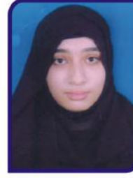
ઝૈબા મો.ઝકરીયા પાંડોર ગામ:- સીમલક ૬૮.૧૬ %